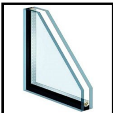
Enkelglas vervangen door HR++ glas