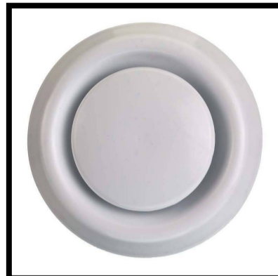
MV incl. CO2 sturing