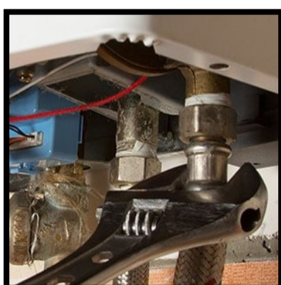
Oude CV- ketels vervangen