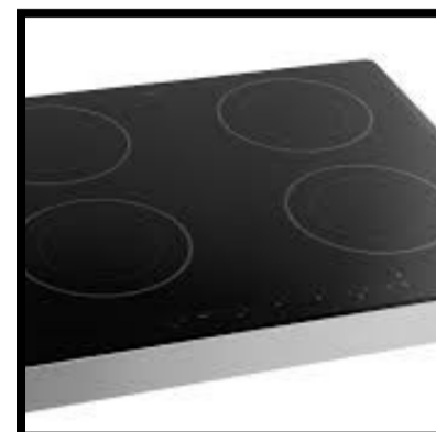
Vorbereiding elektrisch koken