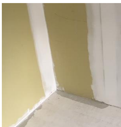
Haakse hoek wanden

Scheurtjes kun je (deels) voorkomen door de haakse aansluitingen in te snijden en daarna af te kitten met een goede kwaliteit acrylaat kit. Daarna kun je vervolgens de wanden sausen. Met plaatsing van behang, zullen deze scheurtjes niet gaan opvallen.