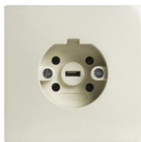
Perilex-aansluiting om te koken.

Je kookt elektrisch en dus niet (meer) op gas. In de keuken zit een perilex-aansluiting voor een elektrisch kooktoestel. Bij het doosje van de perilex stopcontact staat een aanduiding hoeveel fasen deze heeft. Ook staat dit in de meterkast op de groepenverklaring aangegeven.