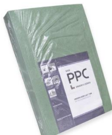
Ondervloer plaat (7 mm dik) is niet nodig