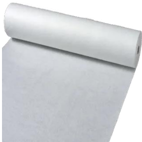
Dun isolatie materiaal op rol

In de verdiepingswoningen is een 30mm. Estrichvloer aangebracht. Heb je 2 verdiepingen? Dan is de bovenste verdieping niet voorzien van een Estrichvloer. De Estrichvloer is een geluid reducerende vloer. Bijna elke soort vloer (zoals: tapijt, hout, laminaat, etc. ) kan hierop geplaatst worden. Om de kleine oneffenheden in de Estrichvloer te kunnen wegwerken voor bijvoorbeeld een laminaatvloer, dien je hiervoor een speciale (dunne) isolatiemateriaal aan te schaffen. Deze is op rol verkrijgbaar.