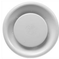
afzuigventiel van mechanische ventilatie