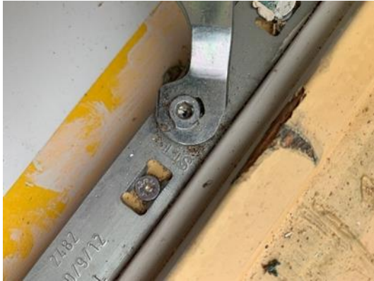
Schaar met imbus schroefje

Het verhuisraam kun je in draaistand open zetten. Je ziet op de onderdorpel een schaar zitten welke weer verbinding heeft met het raam. Geef het imbus-schroefje een halve draai