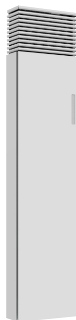
ClimaRad Ventura V1C